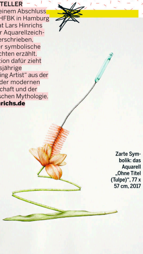
Zarte Symbolik: das Aquarell „Ohne Titel (Tulpe)“, 77 x 57 cm, 2017

Nach seinem Abschluss an der HFBK in Hamburg 2014 hat Lars Hinrichs sich der Aquarellzeichnung verschrieben, in der er symbolische Geschichten erzählt. Inspiration dafür zieht der diesjährige „Emerging Artist“ aus der Kunst, der modernen Gesellschaft und der griechischen Mythologie. larshinrichs.de